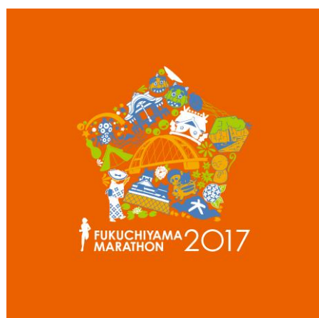
2017年(第27回大会)採用作品