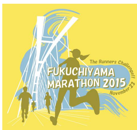
2015年(第25回大会)採用作品