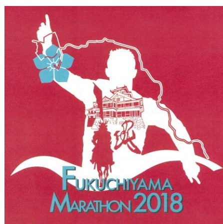
2018年(第28回大会)採用作品