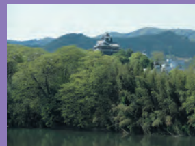
音無瀬橋より望む明智藪と福知山城